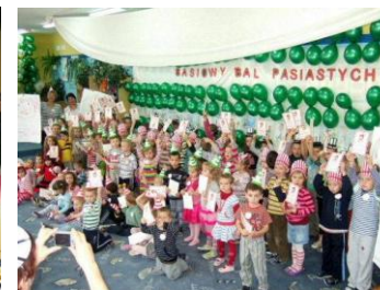
Basiowy Bal Pasiastych