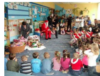
Spotkanie z Mikołajem