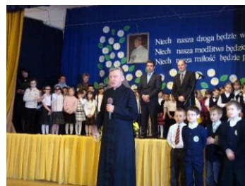
Otwarcie wystawy "Jan Paweł II"