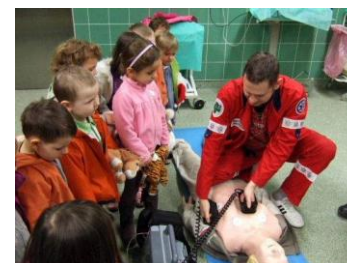
Wizyta na Pogotowiu Ratunkowym