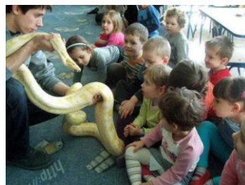
Warsztaty "Gady w teorii i praktyce"