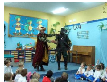
Obchody Święta Niepodległości