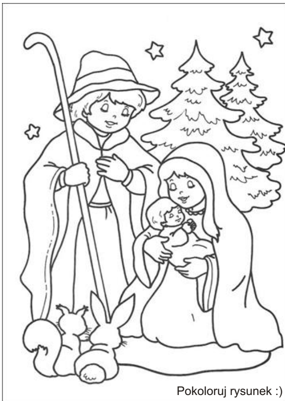
Pokoloruj rysunek :)